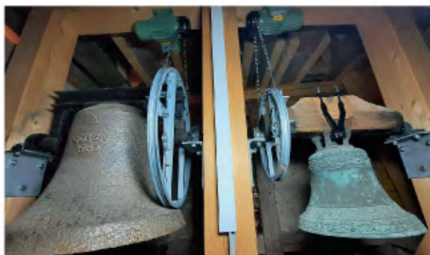
Läuteanlage Kirche Gösen