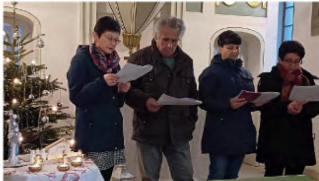
Heiligabend in Gösen