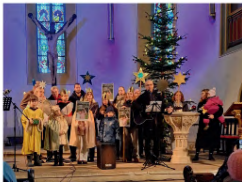
Sternsinger im Allianz-Gottesdienst