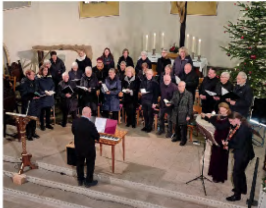
Weihnachtskonzert 27.12. in Eisenberg