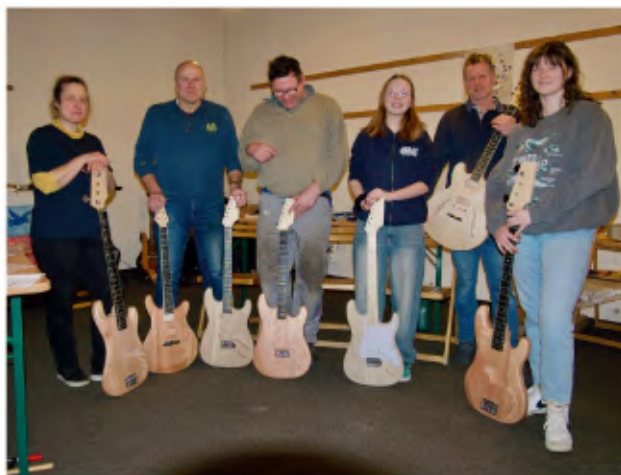
Foto: Mehr als glücklich - stolze Gitarrenbauer/innen